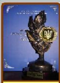
ЛІЦЕЙ - ФЛАГМАН ОСВІТИ УКРАЇНИ